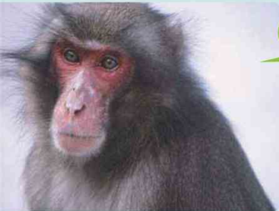
ゴルゴの若い頃 (1988年)