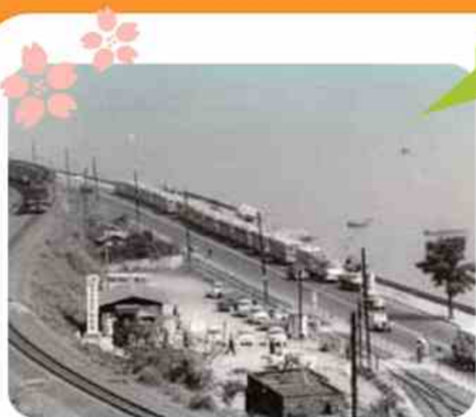
今から半世紀前の 「別大国道」